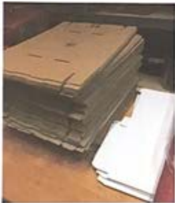
Alles ist verpackt