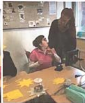
Ein schöner Baum