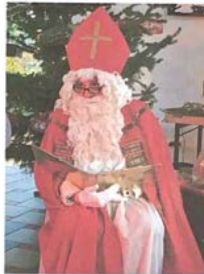
Alles Wichtige darin stand