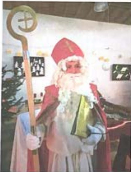
Das goldene Buch in der Hand